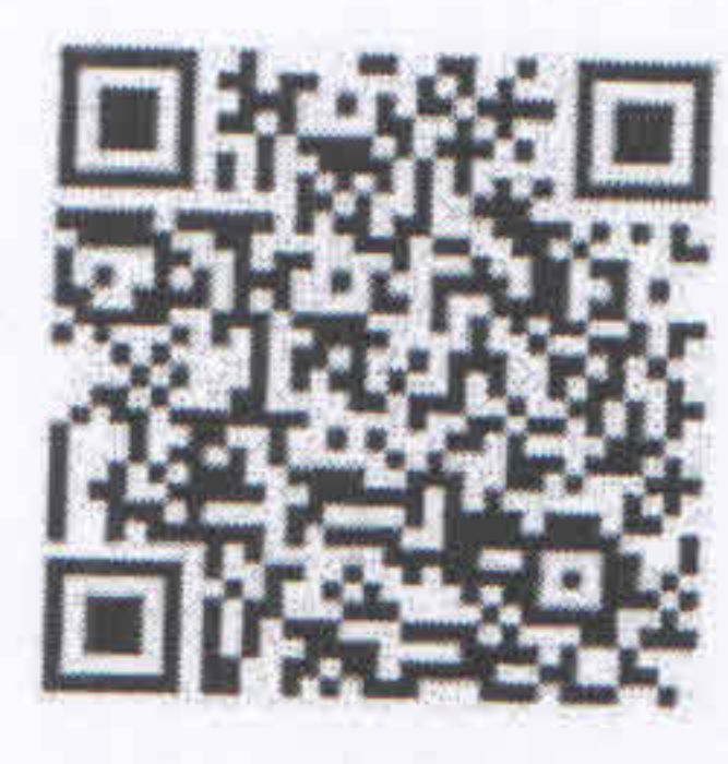
รายงานภาวะสังคมไทย

กองพัฒนาข้อมูลและตัวชี้วัดสังคม โทร. 0 2280 4085 ต่อ 3605 โทรสาร 0 02280 2803 http://social.nesdc.go.th